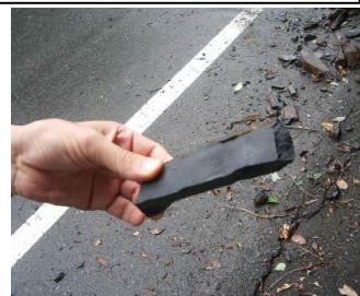
写真 現地調査当日に発生した落石