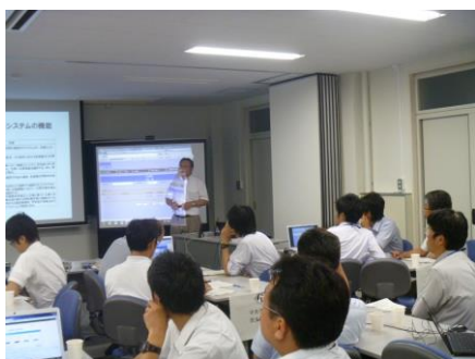
写真 市町村に対するシステム研修の様子